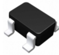
BU4820F-TR Rohm Semiconductor IC VOLT DETECTOR 2.0V SOP4