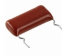
ECW-HC3F562JQ Panasonic Electronic Components CAP FILM 5600PF 5% 3KVDC RADIAL