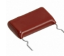
ECW-HC3F822JQ Panasonic Electronic Components CAP FILM 8200PF 5% 3KVDC RADIAL