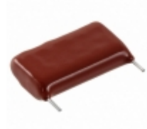
ECW-HC3F822JD Panasonic Electronic Components CAP FILM 8200PF 5% 3KVDC RADIAL