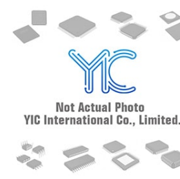
BR24G02FVT ROHM BR24G02FVT ROHM