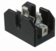
T60060-1CR Eaton FUSE BLOCK CART 600V 60A CHASSIS