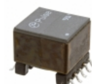
T6003NL Pulse Electronics Corporation TRANSFORMER AUDIO 1:1 SMD