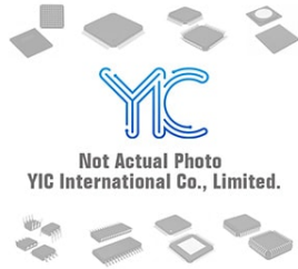
T600F08TEB EUPEC IGBT Modules