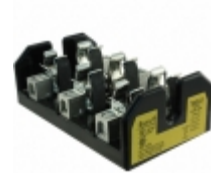
T60060-3CR Eaton FUSE BLOCK CART 600V 60A CHASSIS