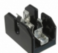
T60060-1SR Eaton FUSE BLOCK CART 600V 60A CHASSIS