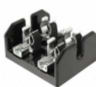
T60060-2SR Eaton FUSE BLOCK CART 600V 60A CHASSIS