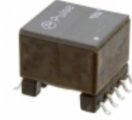
T6003NLT Pulse Electronics Corporation TRANSFORMER AUDIO 1:1 SMD