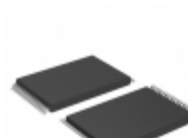
AT49BV002AN-70VU Microchip Technology IC FLASH 2MBIT 70NS 32VSOP