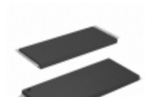
AT49BV002AT-70TI Microchip Technology IC FLASH 2MBIT 70NS 32TSOP