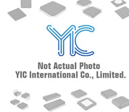
1SMB5919B SUNMATE 1SMB5919B SUNMATE