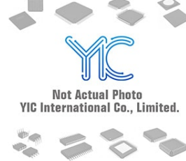
1SMB5917BT3G 4.7V ON ON DO214AA(SMB)