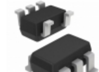
ISL88694IH5 Intersil IC ACCELERATOR I2C 2CH SOT-5