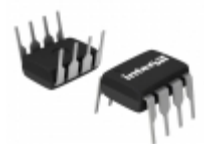
ISL88705IP846Z Intersil IC SUPERVISOR MPU 4.64V 8-DIP