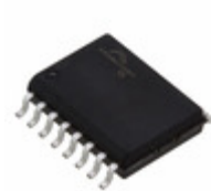
S25FL512SDPMFI011 Cypress Semiconductor Corp IC FLASH 512MBIT 66MHZ 16SOIC