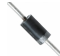
1N4936-TP Micro Commercial Components (MCC) DIODE GPP FAST 1A DO-41