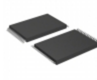
AT49LV002N-70VI Microchip Technology IC FLASH 2MBIT 70NS 32VSOP