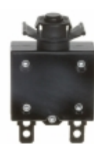
QLB-203-00DNN-3BA Qualtek CIR BRKR THRM 20A 250VAC 32VDC