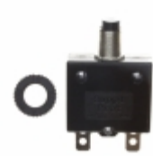
QLB-303-11B3N-3BA Qualtek CIR BRKR THRM 30A 250VAC 32VDC