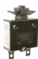
QLB-103-00DNN-3BA Qualtek CIR BRKR THRM 10A 250VAC 32VDC