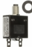
QLB-253-11B3N-3BA Qualtek CIR BRKR THRM 25A 250VAC 32VDC