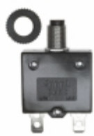
QLB-153-11B3N-3BA Qualtek CIR BRKR THRM 15A 250VAC 32VDC