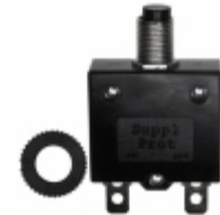
QLB-073-11B3N-3BA Qualtek CIR BRKR THRM 7A 250VAC 32VDC