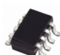
AD5620ARJZ-2REEL7 Analog Devices Inc. IC DAC 12BIT SPI/SRL SOT23-8