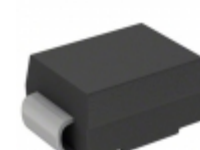
CDBB3200LR-HF Comchip Technology DIODE SCHOTTKY 200V 3A DO214AA