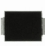
CDBB380-G Comchip Technology DIODE SCHOTTKY 80V 3A DO214AA