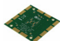
ADA4851-4YRU-EBZ ADI (Analog Devices, Inc.) BOARD EVAL FOR ADA4851-4YRU