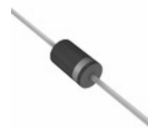
1N5820HB0G TSC (Taiwan Semiconductor) DIODE SCHOTTKY 20V 3A DO201AD