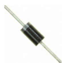
1N5820RL ON Semiconductor DIODE SCHOTTKY 20V 3A DO201AD