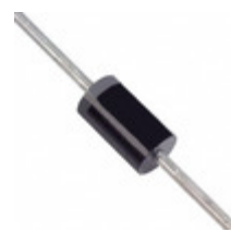
1N5820-T Diodes Incorporated DIODE SCHOTTKY 20V 3A DO201AD