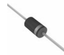
1N5820HR0G TSC (Taiwan Semiconductor) DIODE SCHOTTKY 20V 3A DO201AD