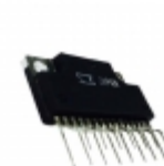
SLA5065 Sanken MOSFET 4N-CH 60V 7A 15-SIP