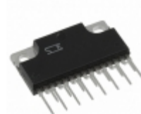
SLA5065 LF830 Sanken MOSFET 4N-CH 60V 7A 15-SIP