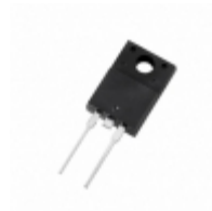
DURF1060 Littelfuse Inc. DIODE RECTIFIER 10A 600V ITO220A