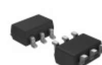
PL602-22TI-T5 Microchip Technology IC CLK BUFFER 125MHZ 6SOT23