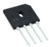
GBU15L05HD2G TSC (Taiwan Semiconductor) BRIDGE RECT 1PHASE 600V 15A GBU