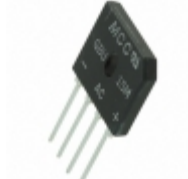
GBU15M-BP Micro Commercial Co BRIDGE RECTIFIER 15A 1000V GBU