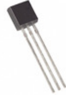
DS18B20+PAR Maxim Integrated SENSOR TEMPERATURE 1-WIRE TO92-3