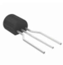
DS18B20-PAR+T&R Maxim Integrated SENSOR TEMPERATURE 1-WIRE TO92-3