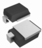
SM6S16A-E3/2D Electro-Films (EFI) / Vishay TVS DIODE 16V 26V DO218AB