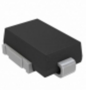
SM6S15ATHE3/I Electro-Films (EFI) / Vishay TVS DIODE 15V 24.4V DO218AC