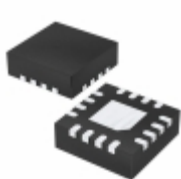
MCP4241T-503E/ML Microchip Technology IC DGTL POT 50K 2CH 16QFN