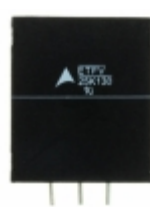
ETFV25K130E4 EPCOS (TDK) VARISTOR 205V 20KA RADIAL