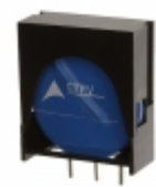
ETFV20K275E2 EPCOS (TDK) VARISTOR 430V 10KA RADIAL