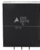
ETFV25K175E4 EPCOS (TDK) VARISTOR 270V 20KA RADIAL