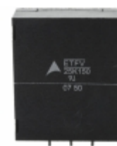
ETFV25K150E4 EPCOS (TDK) VARISTOR 240V 20KA RADIAL