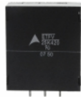
ETFV25K420E4 EPCOS (TDK) VARISTOR 680V 20KA RADIAL