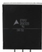
ETFV25K320E4 EPCOS (TDK) VARISTOR 510V 20KA RADIAL