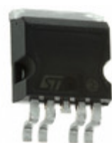
VN920-B5 STMicroelectronics IC DRIVER SINGLE 30A P2-PAK