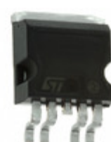
VN920B5-E STMicroelectronics IC DRIVER HIGH SIDE P2PAK