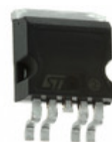
VN920D-B5 STMicroelectronics IC DRIVER HIGH SIDE P2PAK