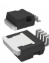
VN920B5HTR-E STMicroelectronics IC DRIVER HIGH SIDE P2PAK