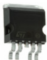
VN920-B5H13TR STMicroelectronics IC SSR HIGH SIDE SGL CHAN P2PAK