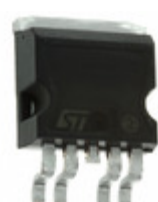
VN920-B513TR STMicroelectronics IC SSR HIGH SIDE 1CH P2PAK-4