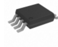
ADM690AARM Analog Devices Inc. IC SUPERVISOR MPU 4.65V WD 8MSOP