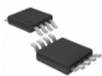
LTC1475CMS8#TRPBF Linear Technology IC REG MULT CONFIG INV ADJ 8MSOP