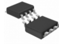
LTC1474IS8-5#TRPBF Linear Technology IC REG MULT CONFIG INV 5V 8SOIC