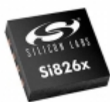
SI8711CD-B-IM Silicon Labs DGTL ISO 5KV 1CH GEN PURP 8LGA