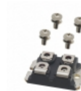
IXTN79N20 IXYS MOSFET N-CH 200V 79A SOT-227