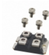
IXTN90N25L2 IXYS MOSFET N-CH 250V 90A SOT-227