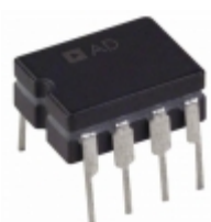
AD829AQ Analog Devices Inc. IC VIDEO OPAMP HS LN 8-CDIP