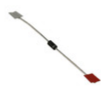
1N4006 Micro Commercial Co DIODE GEN PURP 800V 1A DO41