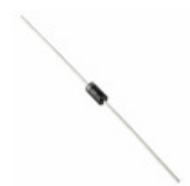
1N4005T-G Comchip Technology DIODE GEN PURP 600V 1A DO41