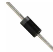
1N4006 Fairchild/ON Semiconductor DIODE GEN PURP 800V 1A DO41