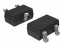
MUN5233T1G ON Semiconductor TRANS PREBIAS NPN 202MW SC70-3