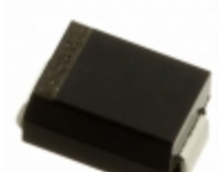
1SMB30A TR13 Central Semiconductor Corp TVS DIODE 30VWM 48.4VC SMB