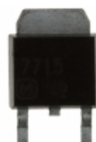
AN7715SP-E1 Panasonic Electronic Components IC REG LDO 15V 1.2A SP3SUA