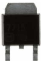
AN7715SP Panasonic Electronic Components IC REG LDO 15V 1.2A SP3SUA