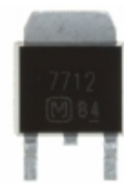
AN7712SP Panasonic Electronic Components IC REG LDO 12V 1.2A SP3SUA