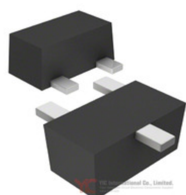
Image may be representation. See specs for product details.