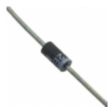
3EZ27D5E3/TR8 Microsemi Corporation DIODE ZENER 27V 3W DO204AL