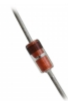
BZX55C6V8_T26A Fairchild/ON Semiconductor DIODE ZENER 6.8V 500MW DO35