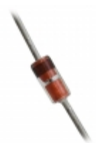
BZX55C6V8 Fairchild/ON Semiconductor DIODE ZENER 6.8V 500MW DO35