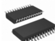
ATF750LVC-15SI Microchip Technology IC CPLD 10MC 15NS 24SOIC