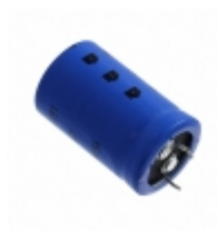
MAL215946829E3 Electro-Films (EFI) / Vishay CAP ALUM 82UF 20% 400V SNAP