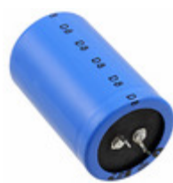
MAL215946391E3 Vishay BC Components CAP ALUM 390UF 20% 400V SNAP