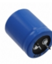
MAL215947101E3 Vishay BC Components CAP ALUM 100UF 20% 450V SNAP