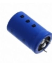
MAL215946829E3 Vishay BC Components CAP ALUM 82UF 20% 400V SNAP