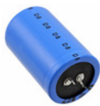
MAL215946271E3 Vishay BC Components CAP ALUM 270UF 20% 400V SNAP