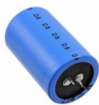
MAL215946271E3 Electro-Films (EFI) / Vishay CAP ALUM 270UF 20% 400V SNAP