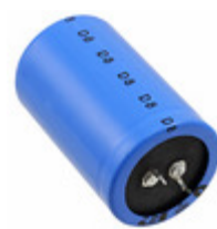
MAL215946221E3 Vishay BC Components CAP ALUM 220UF 20% 400V SNAP