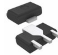
AN77L06M Panasonic Electronic Components IC REG LDO 6V 0.1A 3HSIP