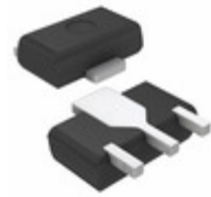
AN77L08M Panasonic Electronic Components IC REG LDO 8V 0.1A 3HSIP