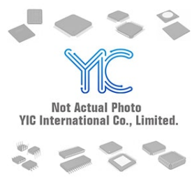
DSA705-20A BBC IGBT Modules