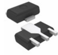
DSA7101R0L Panasonic Electronic Components TRANS PNP 80V 0.5A MINIP-3