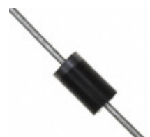
MUR460-M3/54 Vishay Semiconductor Diodes Division DIODE RECT 4A 600V 50NS DO- 201AD