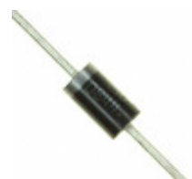
MUR460 ON Semiconductor DIODE GEN PURP 600V 4A DO201AD