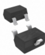
BAS21W-7 Diodes Incorporated DIODE GEN PURP 200V 200MA SOT323