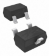
BAS21W-7-F Diodes Incorporated DIODE GEN PURP 200V 200MA SOT323