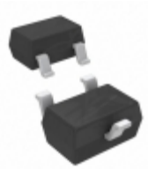
BAS21WT-TP Micro Commercial Co DIODE GEN PURP 200V 200MA SOT323