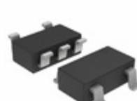
MC74VHC1GT32DTT1 ON Semiconductor IC GATE OR 1CH 2-INP 5-TSOP