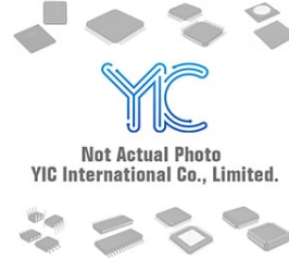
MC74VHC1GT32DFT2G ON ON SOT-353