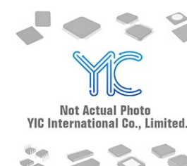
MC74VHC1GT14DTT1G ON MC74VHC1GT14DTT1G ON