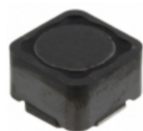
DRA127-R47-R Bussmann (Eaton) FIXED IND 470NH 22.5A 1.2 MOHM