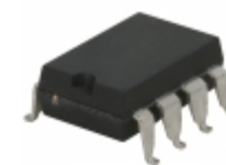
LCA210STR IXYS Integrated Circuits Division RELAY OPTOMOS 85MA DP-NO 8SMD