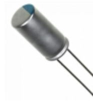
477ULR6R3MFH Illinois Capacitor CAP ALUM POLY 470UF 20% 6.3V T/H