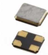
TSX-3225 40.0000MF10Y-K3 EPSON CRYSTAL 40.00 MHZ 10.0PF SMD