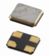
TSX-3225 40.0000MF10Y-K6 EPSON CRYSTAL 40.00 MHZ 10.0PF SMD