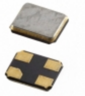
TSX-3225 40.0000MF10Y-N6 EPSON CRYSTAL 40.00 MHZ 13.5PF SMD