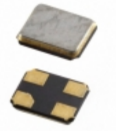
TSX-3225 39.0000MF10Z-G6 EPSON CRYSTAL 39.00 MHZ 20.0PF SMD