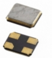
TSX-3225 39.0000MF11P-AJ3 EPSON CRYSTAL 39.00 MHZ 8.0PF SMD