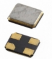
TSX-3225 40.0000MF10Y-K0 EPSON CRYSTAL 40.0000MHZ 10.0PF SMD