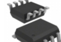
AD8532ARZ-REEL Analog Devices Inc. IC OPAMP GP 3MHZ RRO 8SOIC