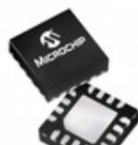
PIC16F18326-I/JQ Microchip Technology IC MCU 8BIT 28KB FLASH 16UQFN