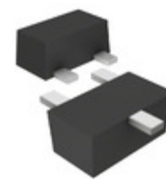
DRC9123J0L Panasonic Electronic Components TRANS PREBIAS NPN 125MW SSMINI3