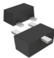
DRC9144E0L Panasonic Electronic Components TRANS PREBIAS NPN 125MW SSMINI3